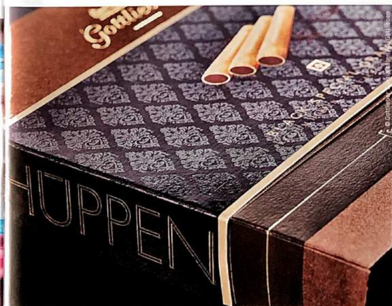
Goldfolie, Matt-/Glanzeffekte und hochwertiges Material sind die Präsentationsfläche für die Gottlieb Hüppen.

RIVAS Die Verpackung soll den Inhalt widerspiegeln, was bei unserer schwarzen Premium-Packung besonders gelungen ist. In der Vergangenheit hat es sich schon mehrmals gezeigt, dass die Verkäufe unserer köstlichen Hüppen durch eine Verpackungsänderung erheblich gesteigert werden konnten. Das Auge kauft mit! Aber natürlich wird das Produkt nur erneut gekauft, wenn auch der Inhalt überzeugt. ■