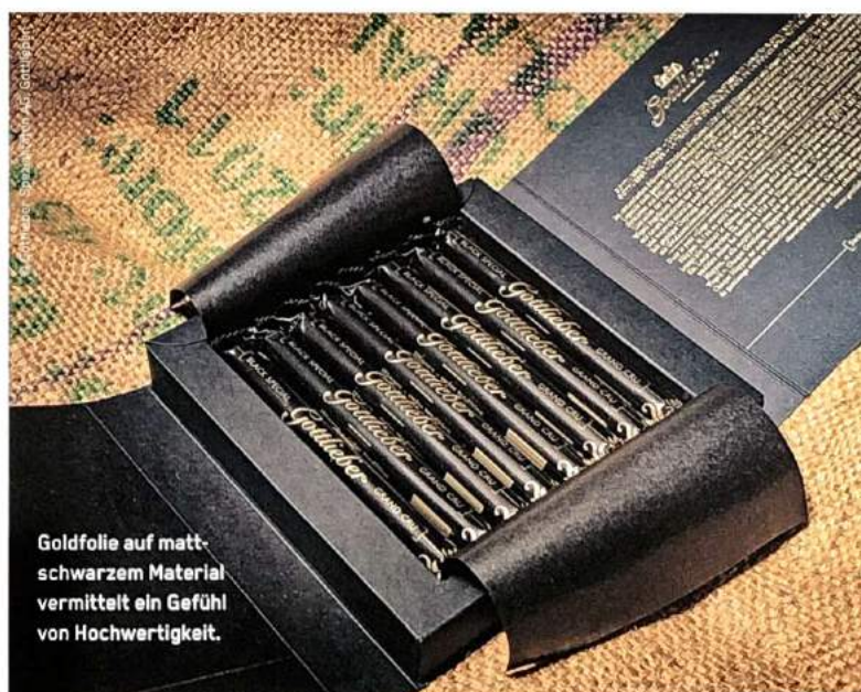
Goldfolie auf matt-schwarzem Material vermittelt ein Gefühl von Hochwertigkeit.