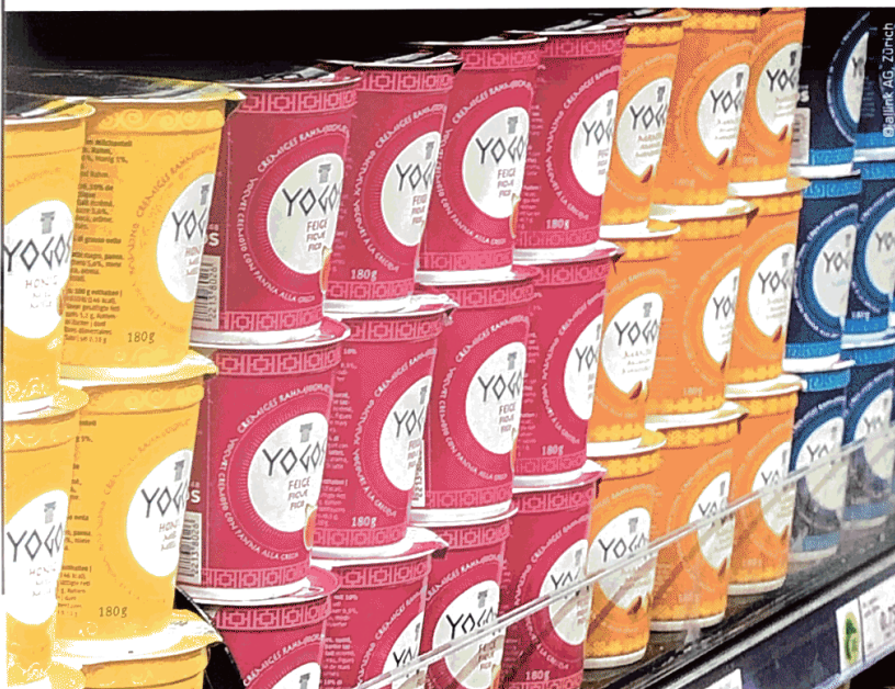
Typografie, Grafik, Farb- und Materialwahl schaffen einen unverwechselbaren Gesamteindruck einer Marke oder Linie.

Verpackungsgestaltung sehen wir als ein Stück strategisch gesteuerte Kunst im Alltag – ein Zelebrieren von Farbe und Form. Packaging Design ist auch Lebensfreude. Mit diesem Anspruch heben sich unsere Verpackungen von der grauen Masse ab und bringen unseren Kunden nachhaltig Mehrwert und Wiedererkennung.