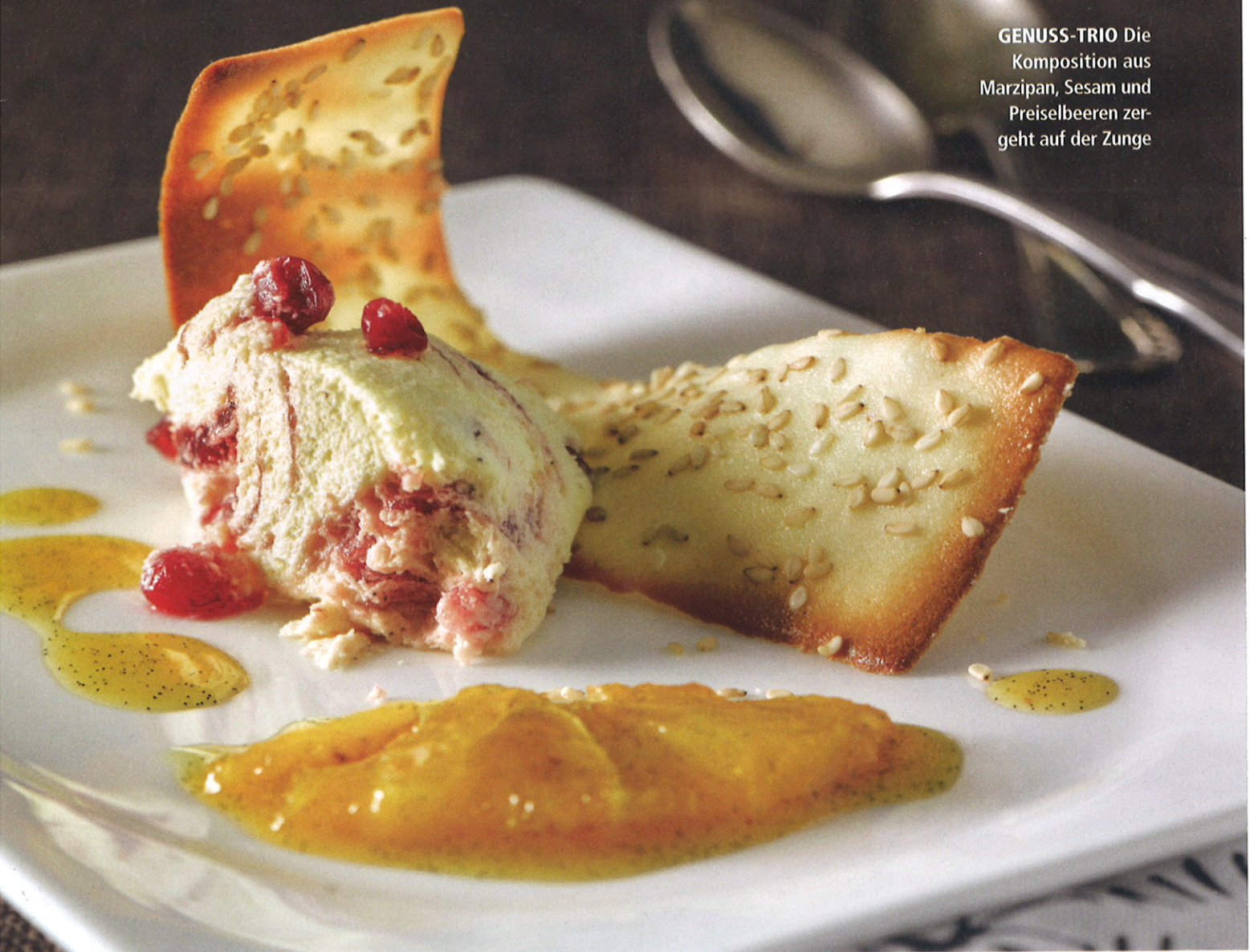
GENUSS-TRIO Die Komposition aus Marzipan, Sesam und Preiselbeeren zergeht auf der Zunge

TIPP: Die übrigen Marzipan-Sesam-Hüppen entweder dazu servieren oder in einer Blechdose aufbewahren, darin bleiben sie ein paar Tage frisch. Sie schmecken übrigens auch prima zu Kaffee oder Tee!