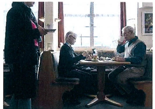
Kaffee und Dessert im Café Ruckstuhl in Trogen.

75 Jahre nach seiner Erfindung ist der Nescafé somit aktueller denn je. Er wird die Geschichte weiter prägen.