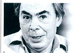
Andrew Lloyd Webber

Seine letzten ganz grossen Erfolge liegen Jahrzehnte zurück. Doch Andrew Lloyd Webber bleibt bis heute der unumstrittene König des Musicals. Zu seinem 65. Geburtstag am kommenden Freitag muss Webber, Sohn eines Musikprofessors und einer Klavierlehrerin, niemandem mehr etwas beweisen. Es dürfte nur wenige Menschen in der westlichen Welt geben, die keinen Song oder Namen eines Musicals von Andrew Lloyd Webber kennen.